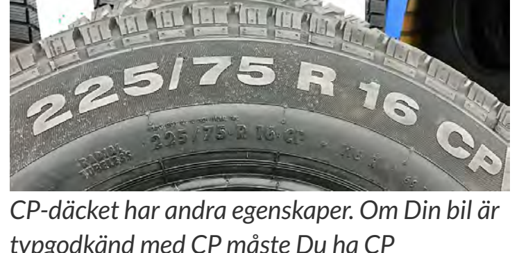
CP-däcket har andra egenskaper. Om Din bil är typgodkänd med CP måste Du ha CP