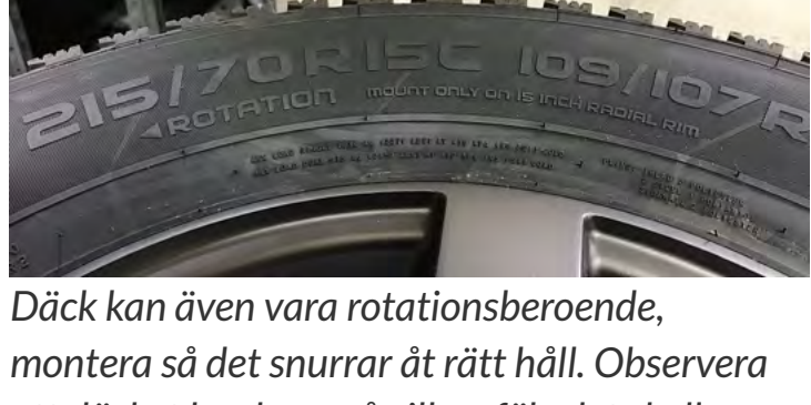
Däck kan även vara rotationsberoende, montera så det snurrar åt rätt håll. Observera att däckets har krav på vilken följd det skall monteras