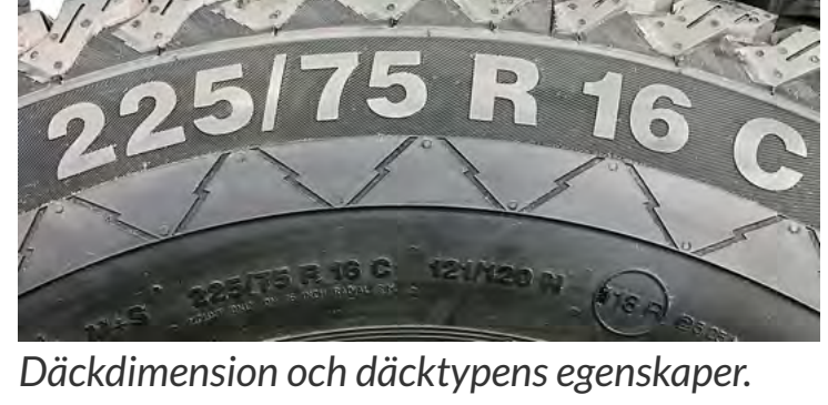
Däckdimension och däcktypens egenskaper. Lastindex i bildens nedkant.

Vi får inte glömma en sak! Det enda som har kontakt och håller oss kvar på vägen är just det vi pratar om = DÄCK. Rätt däck med rätt lufttryck sparar liv och miljö samt även lite pengar.